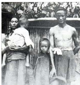
▲600萬台灣人平埔族後代

流散的其它平埔族，雖也有降服清朝被賜姓施的，仍逃不掉漢人勢力進逼，一路由台三線新竹，大溪進入宜蘭，羅東，後零星進入埔里。現今大台中地區已看不見明顯平埔族社區。但身為台中人，我們不能不知道在1648~1732年間中部確實有個大肚王國。