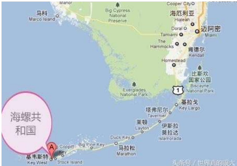
▲海螺共和國地理位置