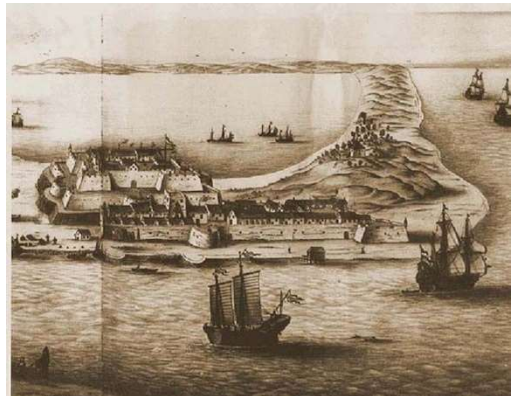
▲1670年熱蘭遮城及附近海邊灣