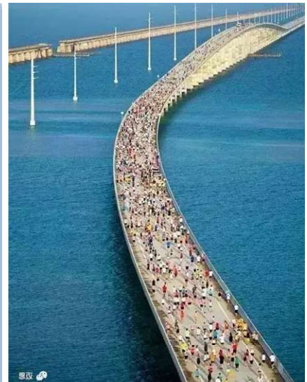
▲邁阿密至基韋斯特的國家一號公路

持了六十秒後，向美國政府投降，但卻要求十億美元的戰爭損失賠償。Uncle George 當然不理他。但路障檢查卻悄悄被撤除了。