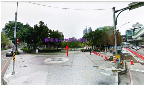
B、D 區及扶少、扶青、RYE 遊行隊伍：文心路一段 VS 大墩七街口