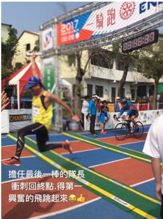
擔任最後一棒的隊長 衝刺回終點，得第一 興奮的飛跳起來👏

比賽的日子終於來臨，摸黑起床，趕赴會場（田中三潭國小），天才微亮，立刻就找到東南愛跑的布條，這是隊長伉儷前一天就來掛上的，果然佔到好位子。會場已是人聲鼎沸，稍做伸展，熱身，領取接力棒。大修教練夫婦也趕來打氣，隨著開跑時間一分分的逼近，心情起伏不定，暗暗祈禱腳踝一定要爭氣。