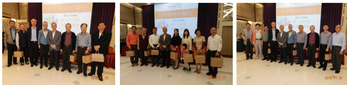
-頒發 7-9 月出席%獎、頒發 7-9 月投稿有功獎-