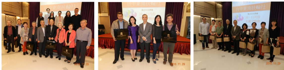
9、10 月生日、結婚紀念快樂!!

隨後的餐宴，享用美食佳餚之餘，社友之間的互相敬酒增添了晚宴熱鬧的氣氛，也拉近了大家之間的距離。