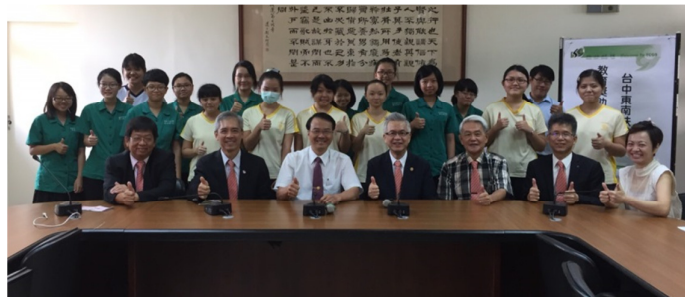
受獎學生的感謝卡...